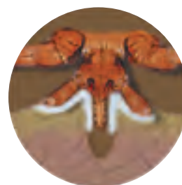
Inoculation salivaire lors du repas de sang