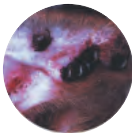
Tiques sur un chien

- utilisez durant la saison des tiques un produit spécifique anti-tiques. Ces produits empêchent les tiques de se fixer et les empêchent d'effectuer leur repas de sang, à l'origine de la transmission de maladies.