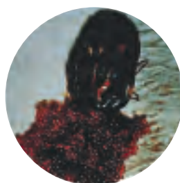
Œufs de tique