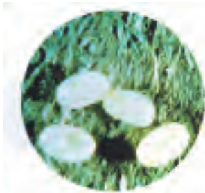
œufs de puce