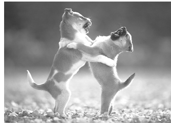
Deux chiots se menacent dans un jeu de lutte

Elle se traduit chez le chien par un ensemble de postures corporelles (par exemple, le regard fixé vers l'individu visé), de mimiques faciales (par exemple, les babines retroussées laissant apparaître les canines) et de vocalises (par exemple, les grondements ou les aboiements). Elle est destinée à éloigner ce que le chien perçoit comme étant un danger. Seule une menace inefficace aboutit à la morsure. C'est pour cette raison qu'il est important de considérer que la menace a d'abord pour fonction d'éviter la morsure.