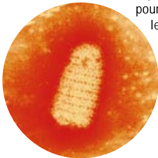
Rhabdovirus en microscopie électronique (virus de la rage)

La vaccination est attestée sur un certificat spécial.